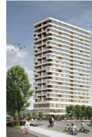
City West Bâtiment H